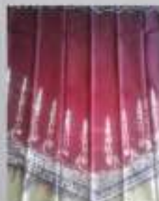
Kode Kain: Sasirangan motif 4