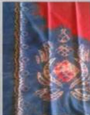
Kode Kain: Sasirangan motif 7