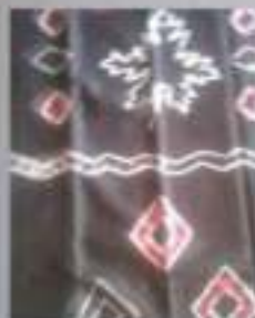
Kode Kain: Sasirangan motif 3