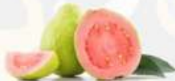
Rasa Jambu Biji