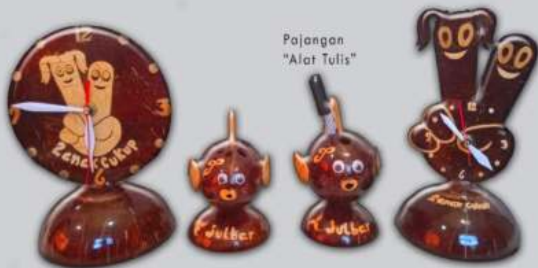
Jam Weker KB "Dua Anak Cukup"