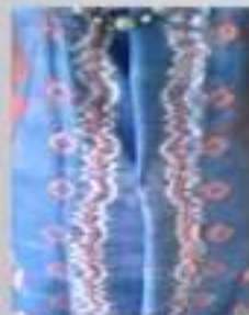
Kode Kain: Sasirangan motif 2