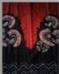
Kode Kain: Sasirangan motif 5