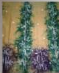
Kode Kain: Sasirangan motif 1