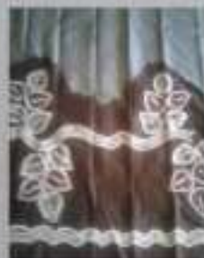
Kode Kain: Sasirangan motif 6